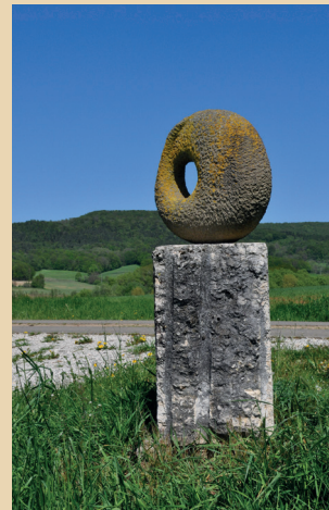
Projektbeispiel Kunst- und Besinnungsweg

„ Kunst- und Besinnungsweg “ Ankauf einiger Skulpturen und Begleitschrift