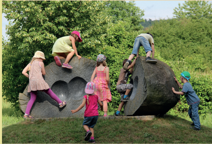
Projektbeispiel Veranstaltungen: Kinderwandertag