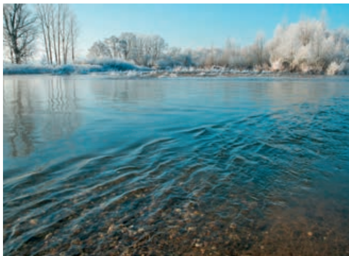
Winter am Obermain. Foto: Thomas Ochs | Für Presse- und Medien für die Berichterstattung zum Flussparadies Franken freigegeben.

Fest für das kommende Jahr eingeplant ist die jährlich stattfindende Müll-Sammel-Aktion am Main und seinen Zuflüssen. Im Rahmen des Aktionsjahres „Mein Main“ des neuen Netzwerks Main soll diese anlässlich des Weltwassertages (22. März) erstmals entlang des gesamten Flusses koordiniert werden. Die Gruppen, die 2021 gesammelt haben, haben verschiedene, gut umsetzbare Konzepte für Hygienemaßnahmen erprobt. Weitere Informationen unter www.flussparadies-franken.de oder www.netzwerkmain.de