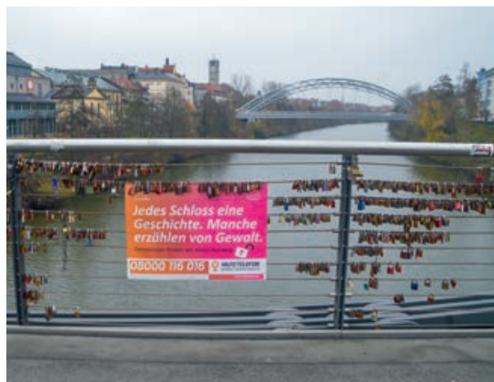
Foto: Plakataktion der Gleichstellungsstellen von Stadt und Landkreis Bamberg zum „Hilfefonnum“

Gerade in der aktuellen Situation, in der die Corona-Pandemie immer wieder einen Rückzug ins Private erfordert, sind Frauen und auch Kinder besonders gefährdet. Betroffene von häuslicher Gewalt müssen jederzeit Zugang zu Schutzangeboten wie Beratungsstellen oder Zufluchtsorten haben. Das bundesweite Hilfefonnum „Gewalt gegen Frauen“ bietet unter der Telefonnummer 0 8000 116 016 rund um die Uhr, anonym und in 18 Sprachen Beratung und Vermittlung in das örtliche Hilfesystem an.