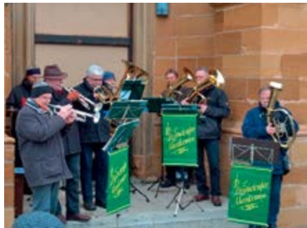
Ein buntes musikalisches Programm begleitete den Weihnachtsmarkt, u.a. spielten die Litzendorfer Musikanten weihnachtliche Klänge vor der Kirche.