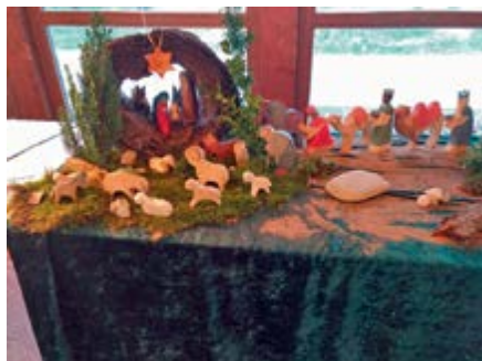
Über 50 private Krippen wurden im Pfarrheim der Öffentlichkeit präsentiert.