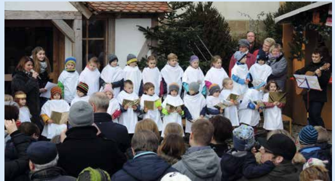
Ein sehr beliebter Programmpunkt: Singspiel des Kindergartens St. Wenzeslaus