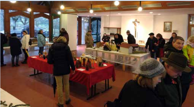
Hunderte von Besuchern interessierten sich für die erstmalige Krippenausstellung