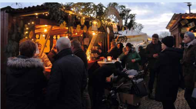
Impression am Stand der KAB Litzendorf