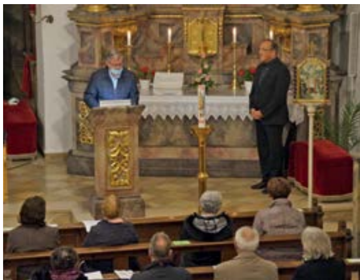
In der Kirche St. Wenzeslaus fanden die 45. Litzendorfer Kerzenlichtkonzerte wieder aufmerksame und begeisterte Zuhörer.