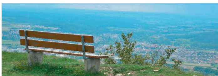
Panoramablick von der Friesener Warte.

Am Sonntag, 10. November führt eine Rundwanderung ab Strullendorf hinauf zur Friesener Warte (562 m über N.N.). Der Plateauberg mit markanten Jurakalksteinen bietet an seiner Westseite einen weiten Blick über das Regnitztal bis in den Steigerwald. Bei günstiger Thermik steigen die Segelflieger auf. Zurück geht es über Amlingstadt und Grenzmühle nach Strullendorf. Gute Kondition sowie festes Schuhwerk ist Voraussetzung für die 16km lange Tour mit 350 hm. Interessierte nehmen Verpflegung und ausreichend Getränke mit, da erst zum Ende der Tour eine Einkehrmöglichkeit besteht. Termin: Sonntag, 10.11.2019, 09:30 Uhr bis ca. 15:30 Uhr, Unkostenbeitrag 5 Euro pro Person, eine Anmeldung ist bei der Tourist-Info Fränkische Toskana erforderlich, Tel. 09505-8064106.