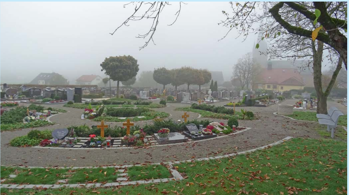
Novemberstimmung am Friedhof Litzendorf