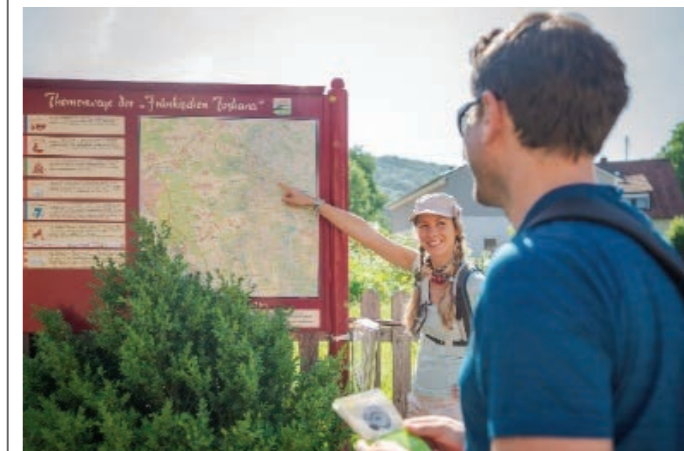
Wanderer an der Wandertafel in Tiefenellern.

Im Bereich des Sängerkreises Bamberg sind folgende Kurstage geplant: 5. November 2022, 14. Januar 2023 und 11. Februar 2023. Weiterführende Informationen sind auf der Homepage des Fränkischen Sängerbundes im Bereich „Fortbildungen“ zu finden: fsb-online.de