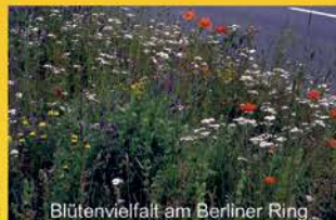
Blütenvielfalt am Berliner Ring