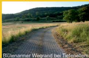
Blütenarmer Wegrand bei Tiefenellern

Feld-, Wege- und Straßenränder in der Gemeinde Litzendorf stellen wichtige Vernetzungselemente in der Landschaft dar. So summiert sich an bayerischen Straßenrändern diese Grünfläche auf rund 30.000 Hektar. Eine Chance für die Artenvielfalt - die allerdings oft wenig genutzt wird.