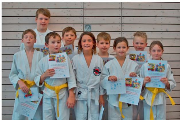
Der Nachwuchs des JC Naisa beim Judo-Spiele-Tag in Hof