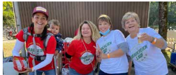
Jung und Alt waren im Einsatz beim Brauereienlauf 2022.

Am 21. September 2024 fällt erneut der Startschuss für ein Sport-Event der besonderen Art: Der Brauereienlauf in der Fränkischen Toskana findet wieder statt. Ob Marathon, Halbmarathon, 10km Lauf oder Bambini-Lauf – der Genuss der Landschaft und der fränkischen Spezialitäten steht bei allen Sportwettbewerben im Vordergrund. Ein Jahr vorher suchen die Veranstalter Tricamp GmbH bereits ehrenamtliche Helfer, die Teil dieses sportlichen Ausnahmeevents sein möchten. Es werden zahlreiche Unterstützer gesucht, z.B. für den Ausschank an Versorgungsstationen entlang der Strecke oder im Zielbereich im Festzelt, für organisatorische Aufgaben oder zur Information der Athleten. Auch der Einsatz von Vereinen zur Aufbesserung ihrer Vereinskasse oder von älteren Schulklassen zur Finanzierung ihrer Abschlussfeier wäre möglich. Der Einsatz erfolgt in den Gemeinden Gundelsheim, Strullendorf oder Litzendorf. Für alle gibt es ein Helfer-T-Shirt, Verpflegung während des Einsatzes und zu einem späteren Zeitpunkt eine Helferparty. Darüber hinaus können sich regionale Firmen bereits jetzt über Sponsoring-Möglichkeiten und zielgruppengerechte Werbemöglichkeiten vor und während des Brauereienlaufs informieren. Informationen gibt es auf www.brauereienlauf.de , Helfer melden sich an unter info@brauereienlauf.de .