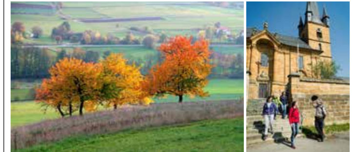
Herbstlandschaft im Ellertal.