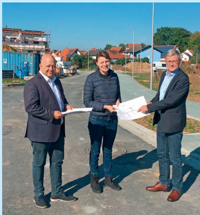
MdB Emmi Zeulner und MdL Holger Dremel lassen sich bei der Übergabe der Förderbescheide die Gesamtplanung vom Ersten Bürgermeister Wolfgang Möhrlein erläutern.

Nach vielen Fachgesprächen mit der Regierung und mit Unterstützung der Politik überreichten nun persönlich die Stimmkreisabgeordneten vom Bundestag Emmi Zeulner mit dem Landtagsabgeordneten Holger Dremel dem