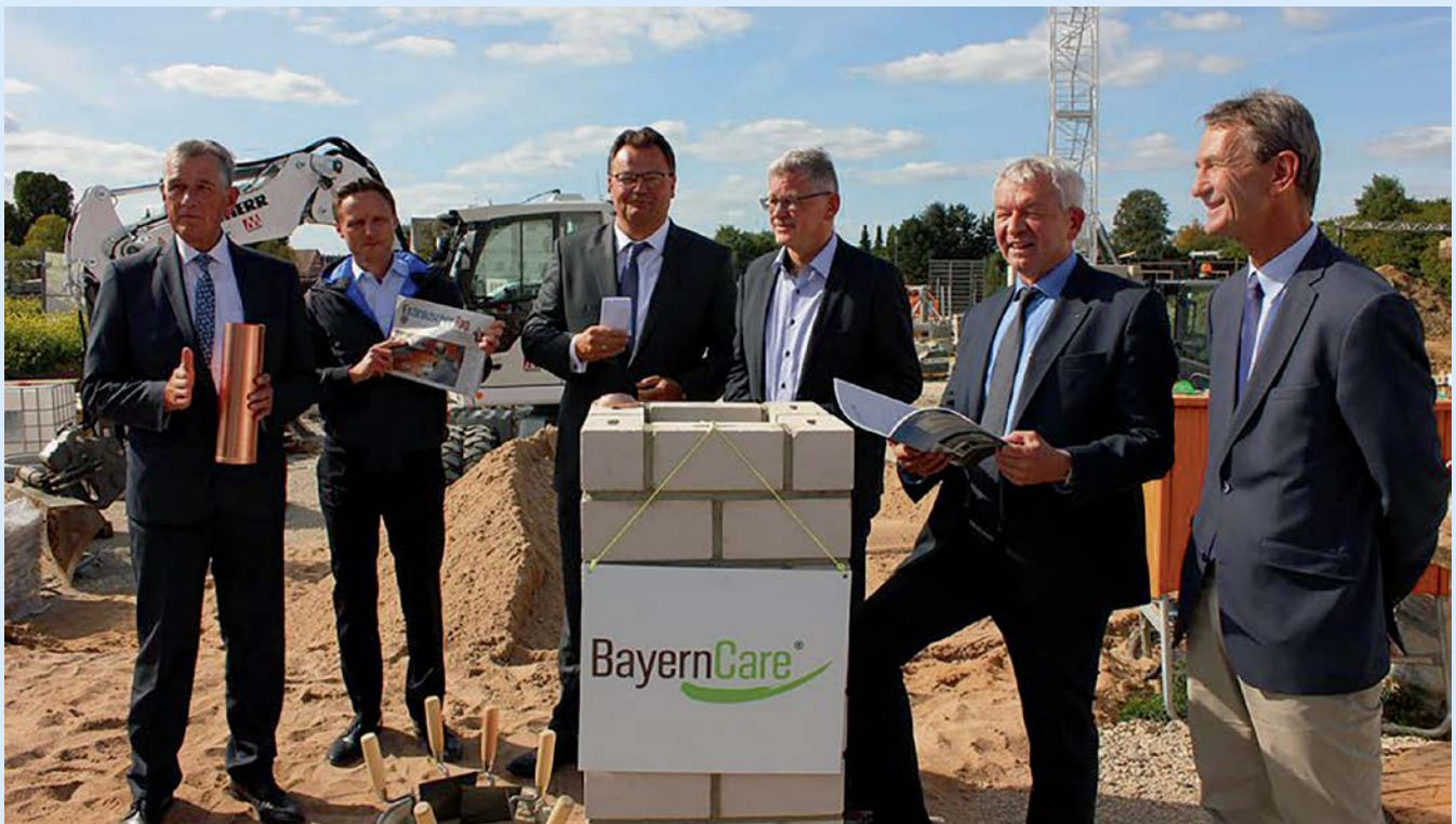
Grundsteinlegung für neue Seniorenwohnanlage in Litzendorf

Im EllernPark werden insgesamt 33 seniorengerechte 1- bis 3-Zimmer-Wohnungen zwischen 47 und 81 Quadratmetern entstehen. Im Erdgeschoss des westlichen Gebäudeteils ist eine separate Tagespflege-Einrichtung geplant, die von der Diakonie Bamberg-Forchheim betrieben wird. Alle seniorengerechten Wohnungen werden über ein Servicepaket verfügen, das unter anderem eine 24-Stunden-Notrufbereitschaft und Beratungshilfen umfasst, die ebenfalls von der Diakonie angeboten werden.