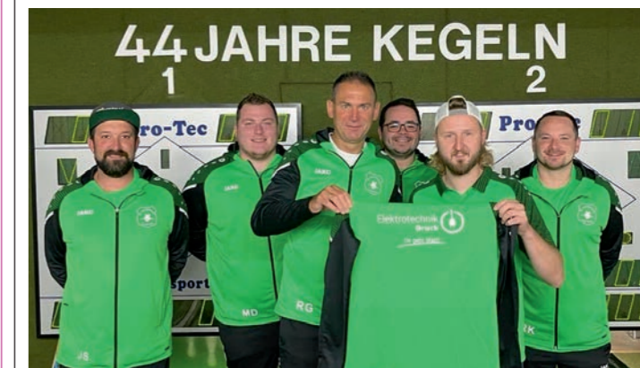
Die Kegelabteilung des SC Melkendorf bedankt sich hiermit recht herzlich bei Elektrotechnik Druck aus Tiefenellern für das Sponsoring der neuen Trainingsanzüge.

Des Weiteren wurden die Mannschaften pünktlich zum Saisonstart mit neuen Trikots und Trainingsanzügen ausgestattet.