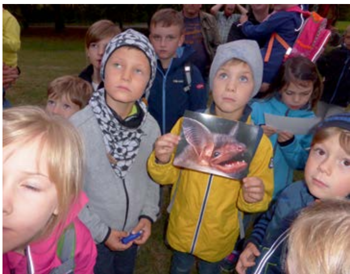
Text und Photos: Claudia Dworazik

Dass wir am Abend in Lohndorf nicht von den zahlreichen Mücken zerstoßen wurden, verdanken wir den eifrig jagenden Fledermäusen. Ihre Ultraschallrufe machte der Biologe vom Bund Naturschutz für uns mit einem Spezialgerät hörbar, das sogar die Art der umherfliegenden Fledermäuse unterschied. Für die Kinder und auch teilnehmenden Eltern interessant.