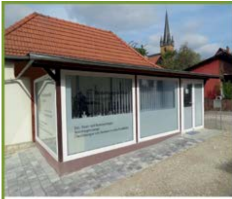
Bachstrasse 6, Litzendorf