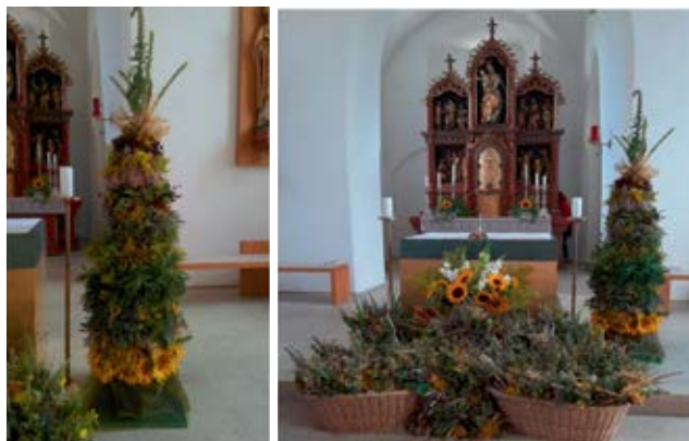
Voranzeige: Erntedankfest mit Kinderwettbewerb am 06.10.2019