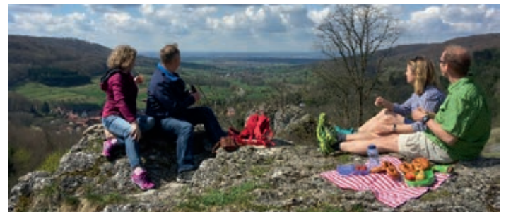
Blick vom Eulenstein auf das Ellertal.