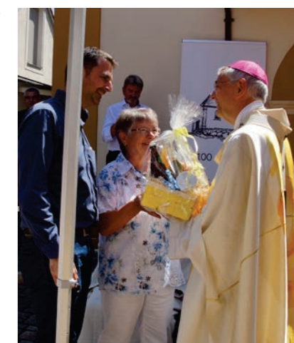
Die Melkendorfer bedankten sich bei Erzbischof Ludwig Schick mit einem Präsentkorb.

Dann begannen das Mittagessen und das weitere gesellige Beisammensein, das sich bis in den Abend hinzog. Dabei wurden viele Erinnerungen aus den früheren Zeiten aufgefrischt. Reiner Dorscht und das Kirchenverwaltungsgremium möchten auf diesem Wege noch einmal allen danken, besonders auch den anonymen Geldspendern, die zum Gelingen des großen Festes beigetragen haben. Joseph Beck