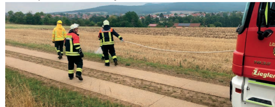
Löschen vom fahrenden Fahrzeug aus. "Pump & Roll"

Vegetations- und Waldbrände beschäftigen dieses Jahr die Feuerwehren wieder und wieder. Aufgrund der Trockenheit in diesem Jahr sind Wald- und Flächenbrände an der Tagesordnung der Feuerwehren und Katastrophenschutzeinheiten. Auch die Gemeinde Litzendorf blieb davon nicht verschont. Deshalb wurden die Feuerwehren der Gemeinde Litzendorf am 20. August durch die gemeinnützige Hilfsorganisation @fire - Internationaler Katastrophenschutz im Umgang mit Wald- und Vegetationsbränden ausgebildet. @fire besteht seit 20 Jahren und bildet nach internationalen Vorgaben Experten in der Vegetationsbrandbekämpfung aus und verfügt über Einsatzkräfte zur nationalen und internationalen Unterstützung. Auch in der Sächsischen Schweiz kamen sie zum Einsatz. Seit vielen Jahren überträgt @fire internationales Wissen und Erfahrung auf das Deutsche Feuerwehrsystem und bietet Ausbildungen für kommunale Feuerwehren an.