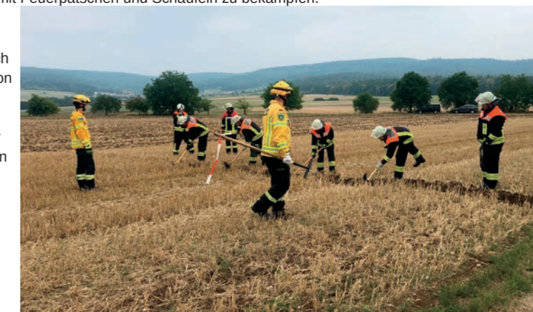
Anlegen eines Wundstreifens

Hinweis: Die Ausbildung wurde von einem Filmteam des BR Fernsehens begleitet. Der Beitrag wurde in der Frankenschau aktuell am 23.08.2022 gezeigt und ist unter www.br.de/mediathek/video/proben-fuer-den-ernstfall-nuernberger-waldbrand-experte-schult-feuerwehrleute-av:63050daa3d042900088b9a8c abrufbar.