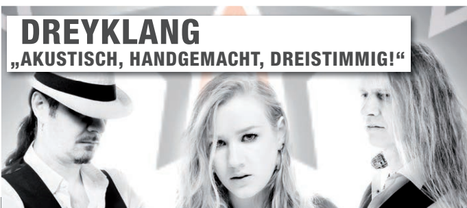
DREYKLANG „AKUSTISCH, HANDGEMACHT, DREISTIMMIG!“

FR | 09.12. | 20 UHR Lohndorf | Saal der Brauerei Reh