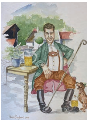
Aquarell: Juan Seyfried: „Der Chef im Garten / Gemütlichkeit“, 2019

Litzendorf, im Juli 2022: Ausdrucksstarke Aquarelle des Künstlers Juan Seyfried sind noch bis 20. August in der Tourist-Info Fränkische Toskana in Litzendorf ausgestellt. Begeistert sind die bisherigen Besucher von den idyllischen Landschaften der Fränkischen Toskana, den farbenfrohen Stillleben, surrealistischen Bildern und dem allgegenwärtigen Motiv „Bier“.