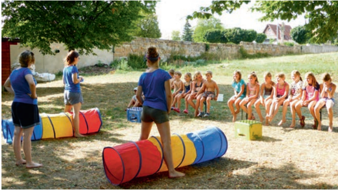
Bunte Röhren und Kinder auf der Pfarrheimwiese

Gerade richtig in der Sommerhitze gelegen kam das diesjährige Thema des Spielmobils Chapeau Claque. Alle lustigen Wettspiele hatten mit erfrischem Wasser zu tun. Auf dem Bild mussten die Kinder mit kleinen, wassergefüllten Schälchen durch die bunten Stoffröhren kriechen, möglichst ohne einen einzigen Tropfen zu verschütten. Beide Mannschaften erwiesen sich allerdings als praktisch gleich tüchtig und schnell.