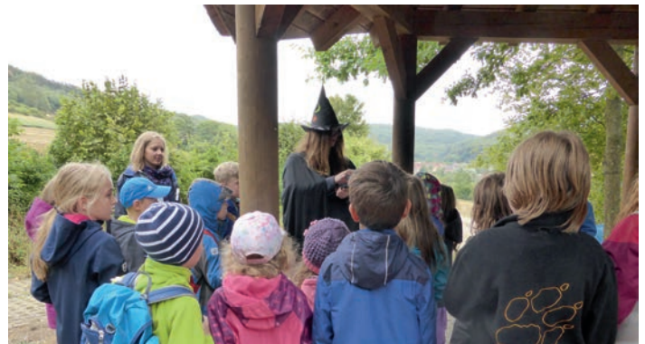
Text und Photos: Claudia Dworazik

Ein geheimnisvolles Hexenwesen weihte die Kinder in die Eulenkunde ein. Zaubersprüche lernen, Amulette basteln, geheime Botschaften suchen und entschlüsseln und dabei spielerisch das Wissen über die nächtlichen Jäger erwerben; Das alles wurde mit einem Eulendiplom belohnt. Super!