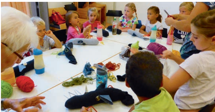
Kinder mit Steckenpferden

Gut, dass es noch ein paar grüne Blattbüschel zum Fressen für die lieben, selbstgebastelten Steckenpferde gab. Die Reiterinnen waren glücklich und stolz auf ihre in schwieriger Nährarbeit gefertigten Tiere.