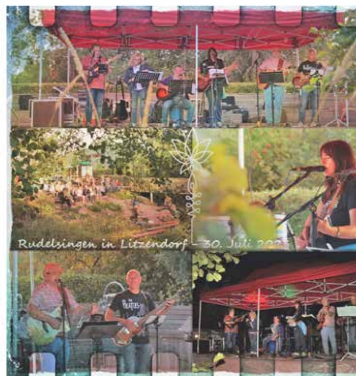
Impressionen vom Rudelsingen