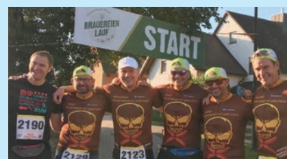
Einen fröhlichen und unfallfreien Verlauf wünschen sich die Organisatoren des 3. Brauereienlaufs. Viel Spaß hatte auch das Team „Bratwurst United“ beim letztjährigen Brauereienlauf.

Weitere Infos und Anmeldung unter www.brauereienlauf.de .