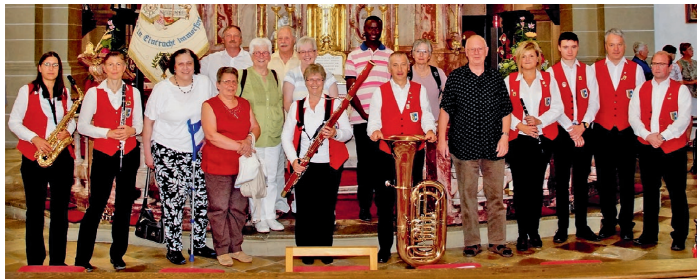
Der Männergesangsverein und das Jugendblasorchester Pödelndorf vor dem Gnadenaltar

Das Jubiläum wurde vom plötzlichen Tod des Wallfahrts Pfarrers Uwe Hartmann überschattet.