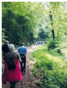
Wanderung durch das Zeegenbachtal.