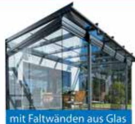
mit Faltschichten aus Glas