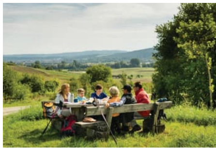
Brotzeit am Kraiberg

Die Strecke ist für Kinder, Familien und geländetaugliche Kinderwagen geeignet.