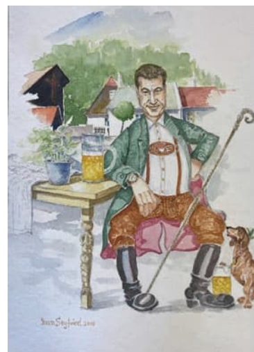
Aquarell: Juan Seyfried: „Gemütlichkeit“, 2019

Idyllische Landschaften der Fränkischen Toskana, farbenfrohe Stilleben, tiefgründige surrealistische Bilder und immer wieder auch Bilder mit dem Motiv „Bier“ wurden vom Tiefenellerner Künstler in den letzten drei Jahren geschaffen. Seine Kunst ist die Sprache seiner Seele und bringt Bilder teils mit scharfsinnigem Witz, teils mit fremden und fantasievollen neuen Welten hervor.