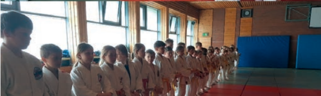
Volle Matte: knapp 50 Kinder sorgten dafür, dass die Untere Halle fast aus den Nähten platzte