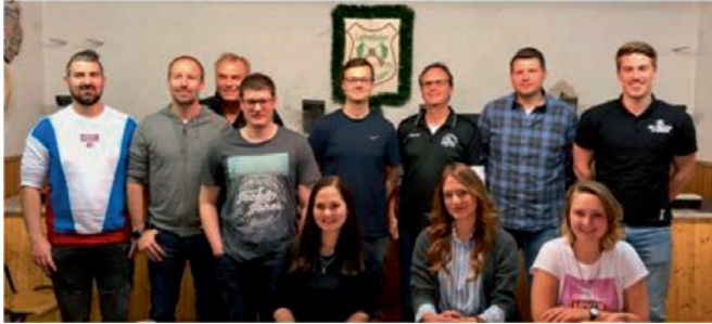
Im Bild: Das stark verjüngte (aber nicht vollständige) BGL-Gremium

Eine kleine Aufmerksamkeit wurde bereits bzw. wird noch überreicht. Ebenso herzlich darf die neu gewählte "Young Generation" begrüßt werden; das gesamte Gremium freut sich auf gute, konstruktive Zusammenarbeit.