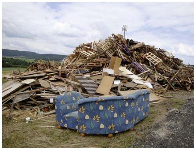
Foto (Quelle: Landratsamt Bamberg): Johannisfeuer werden immer öfter zur Müllverbrennung missbraucht.

Weitere Informationen können im kostenlosen Flyer „Johannisfeuer – Zwischen Tradition und Recht“ nachgelesen werden. Dieser ist sowohl am Landratsamt Bamberg als auch bei den Gemeinden erhältlich und kann zudem im Internet unter www.landkreis-bamberg.de/Formulare_und_Broschüren , Stichwort „Umwelt“ herunter geladen werden.