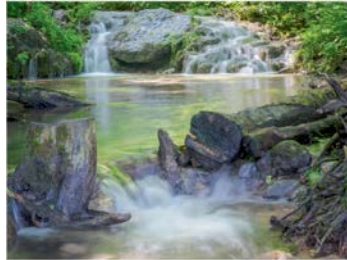
Sinterterrassen bei Tiefenellern

Im Juni finden wieder zahlreiche geführte Wanderungen und Führungen in der Fränkischen Toskana statt. Eine Anmeldung ist unbedingt erforderlich bei der Tourist-Info Fränkische Toskana, Tel. 09505-80 64 106, info@fraenkische-toskana.com .