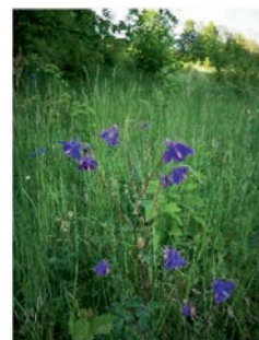
Blühende Pflanzen im Ellertal

Im Juni finden wieder zahlreiche geführte Wanderungen und Führungen in der Fränkischen Toskana statt. Eine Anmeldung ist unbedingt erforderlich bei der Tourist-Info Fränkische Toskana, Tel. 09505-80 64 106, info@fraenkische-toskana.com .