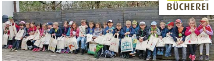
Die Vorschulkinder aus dem Haus für Kinder am Ellerbach sind nun fit für die Bücherei

Insgesamt 43 Vorschulkinder der beiden Kindergärten in Litzendorf durften auch in diesem Jahr wieder ihren Büchereiführerschein in der Bücherei machen. Sinn und Zweck dieser Veranstaltung ist es die Kinder den Umgang mit Büchern und der Bücherei vertraut zu machen und ihnen spielerisch die Freude am Lesen zu vermitteln. Vier Aufgaben hieß es zu bewältigen, "Erzählen und Wissen", "Vorlesen, Zuhören, Ausmalen", "Aussuchen und Ausleihen" und "Was gibt es, wo finde ich es?". So wurden die Kindergartenkinder aktiv und altersgerecht an Inhalte und Benutzung einer Bücherei herangeführt. Mit sehr viel Eifer und voller Begeisterung waren die Kinder bei der Sache. Für jede erfüllte Aufgabe wurden sie mit einem Stempel belohnt.