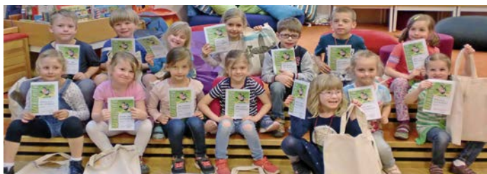
Die Vorschulkinder aus dem Kindergarten Sankt Wenzeslaus freuen sich über ihren Büchereiführerschein.

So erfuhren die Vorschulkinder nicht nur, dass Lesen Spaß macht, sondern auch, dass Büchereien ein vielfältiges Angebot an Wissen bereithalten. Zum Schluss erhielt jedes Kind nicht nur seine selbst bemalte und vom Büchereiteam befüllte Büchertasche, sondern auch seinen "Büchereiführerschein".