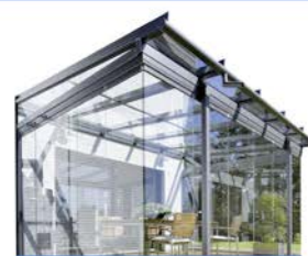
mit Faltwänden aus Glas