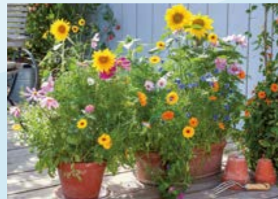
Balkonkübel mit bienenfreundlicher Saat-Mischung, Ringelblumen, Sonnenblumen, Schmuckkübchen und Kornblumen