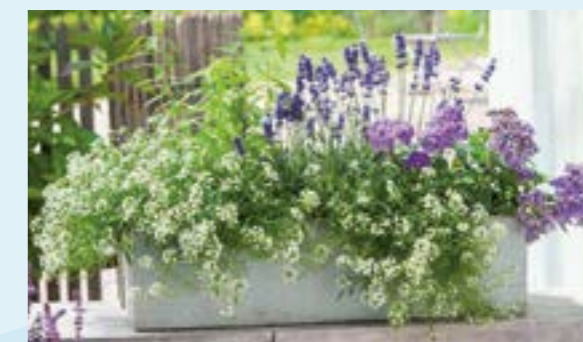
Ein Pflanztrog mit Duftpflanzen wie Lavendel, Vanilleblume oder Duftsteinrich begeistert Menschen und Insekten

Weitere Tipps und Pflanzenvorschläge finden sie beispielweise auf den Internetseiten des Bund Naturschutzes, des NABU oder bei verschiedenen (Online-)Gartenmagazinen. Oder Sie lassen sich in der Gärtnerei beraten!