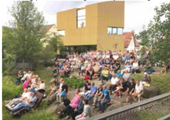
Sommertheater in der Ortsmitte 2023

Die letzte Sitzung von Lebendiges Litzendorf e.V. am 11. April 2024 diente dazu, einen Austausch zwischen den Arbeitsgruppen und Vereinen über geplante Veranstaltungen und Projekte zu ermöglichen.