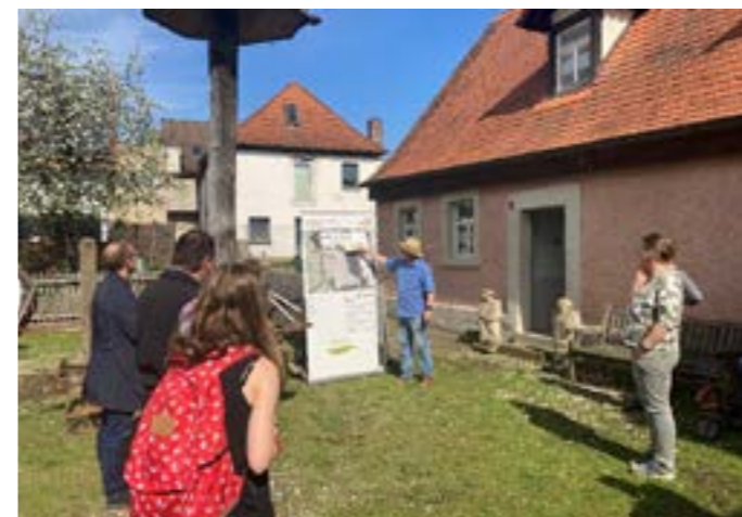
Das frühere bäuerliche Leben können Interessierte am 5. Mai im historischen Kulturbauernhof in Strullendorf entdecken. Im Rahmen des „Heimat.Erlebnistages“ finden mehrere spezielle Führungen und Wanderungen in der Fränkischen Toskana statt.