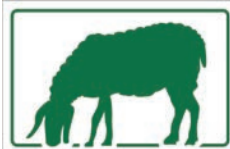
Markierungszeichen für den Wanderweg „Blühender Jura - Auf den Spuren der Schäferei“

Die Wanderbrochure „Blühender Jura – Auf den Spuren der Schäferei“ ist beim Landschaftspflegeverband Landkreis Bamberg und den Projektgemeinden erhältlich. Weitere Informationen findet man auch unter www.lpv-bamberg.de/bluehender-jura/wanderfuehrer-bluehender-jura oder www.fraenkische-toskana.com/de/ . Hier kann man auch die genauen Wegverläufe als GPX-Dateien herunterladen und sich im Bayernatlas anschauen.