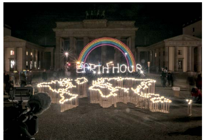
Earth Hour 2021 am Brandenburger Tor in Berlin.

In Deutschland steht die weltweite Aktion 2022 erneut im Zeichen des Klimaschutzes, denn wenn es in diesem Jahrzehnt nicht endlich gelingt, die Erderhitzung auf 1,5 Grad zu begrenzen, drohen Mensch und Natur katastrophale Konsequenzen. Dieses Jahrzehnt und diese Legislaturperiode werden darüber entscheiden, ob wir die Klimakrise noch auf ein kontrollierbares Maß beschränken können.