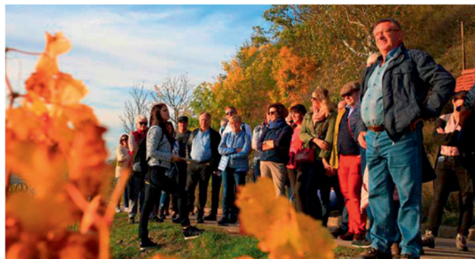
Als Rückblick ein Bild von unserer Weinfahrt 2019 nach Ippesheim ins Weinparadies Franken. Schön war's bei Wein mit Schokolade.