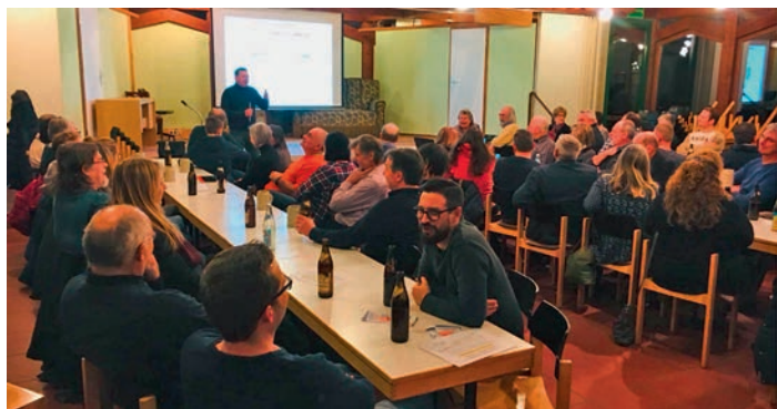
Der Arbeitskreisleiter CO2-Reduzierung begrüßt die Gäste.

Es ist noch viel zu tun. Der Arbeitskreis CO2-Reduzierung nimmt gerne noch Mitglieder auf, um noch mehr zu bewirken.