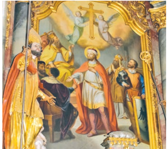
Die Litzendorfer Pfarrkirche feiert heuer ihr 300-jähriges Bestehen. Das Hochaltarbild zeigt den Patron der Kirche, den heiligen Wenzeslaus.

In diesem Jahr wird die Litzendorfer Pfarrkirche St. Wenzeslaus 300 Jahre alt. Zu diesem Jubiläum haben die Gläubigen der Pfarrei ein üppiges Jahresprogramm erstellt. Es begann schon an Silvester mit einer Feier mit Buffet und Musik im Pfarrheim Litzendorf mit einer kurzen Andacht um 23.30 Uhr. Diese Silvesterfeier war schon kurz nach der Planung – als sie noch gar nicht richtig publik war – ausverkauft. Am vergangenen Sonntag war dann auch der spirituelle Auftakt: ein musikalisch vom Männergesangverein Liedertafel Melkendorf umrahmter Gottesdienst in der „Jubelkirche“.