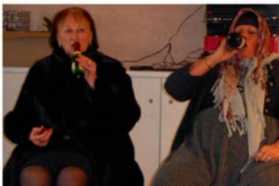
Wann kommt endlich die Eisenbahn? ...Vornehm trifft auf Tradition

Bitte beachten: Der Faschingsnachmittag von KAB und Frauenbund im Gasthaus Krapp findet am Freitag, 9. Februar 2018 , statt.