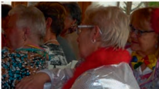
Hin und weg ... volle Konzentration