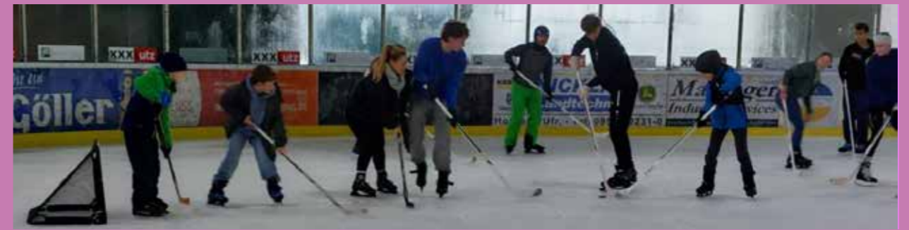
„Coole“ Momente des Familien-Event on Ice am 5.1.2024 in der Eissporthalle Haßfurt